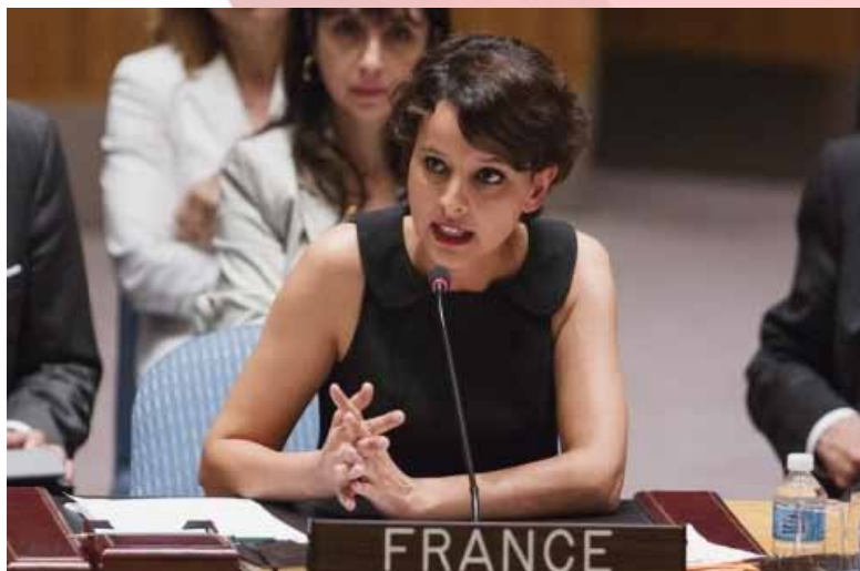
Francia Nőjogi miniszter Najat Vallaud-Belkacem

Februárban kerül sor az egyik strasbourg-i plenáris ülésen a szavazásra.